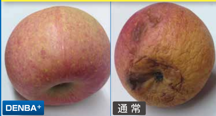
りんごの鮮度比較実験(4カ月後)