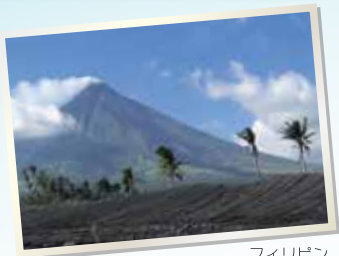
フィリピン ルソン島 マヨン火山

肥沃な火山灰土のあるフィリピン・ルソン島南部にて品質管理された100%オーガニックのココナッツを使用しています。